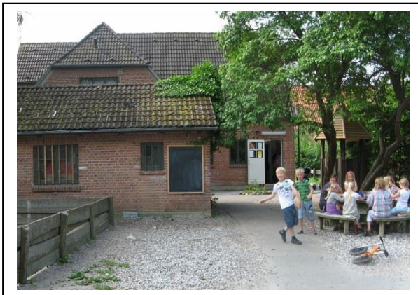
Valnødden / 0. klasse